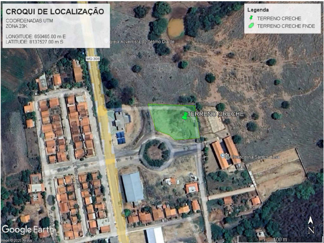
CROQUI DE LOCALIZAÇÃO ESC: 1 : 100